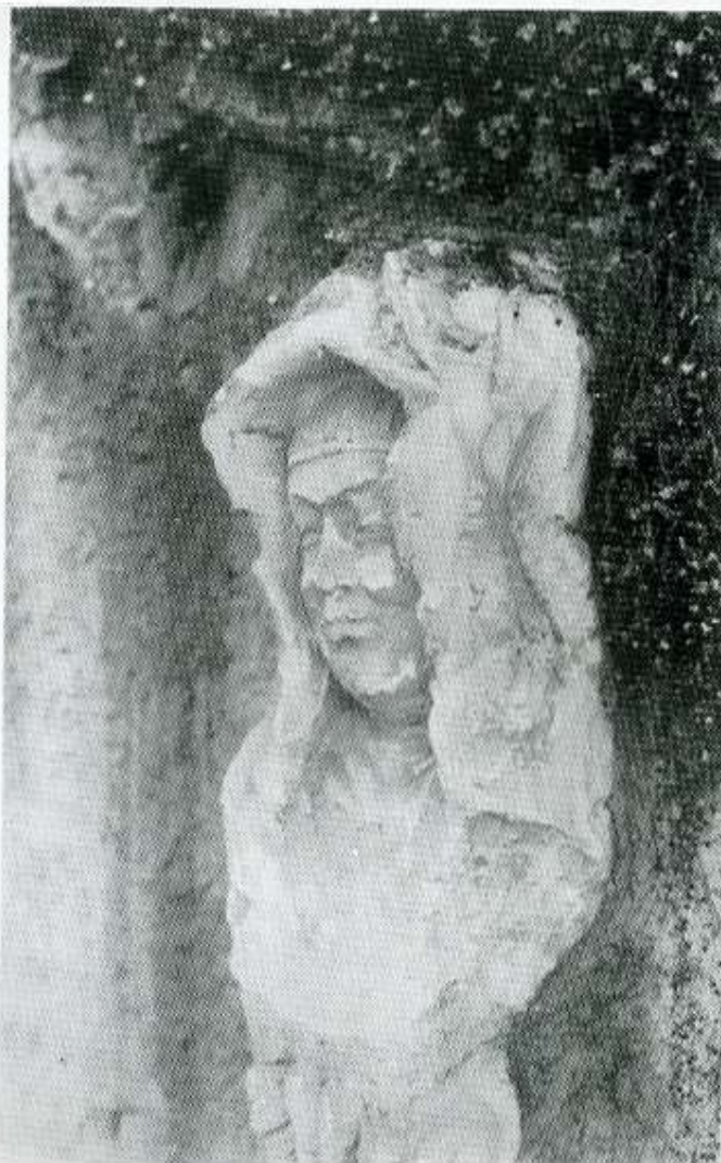
Sur le chantier du Centre Culturel, les travaux de dégagement de l'Ancien Couvent ont permis de mettre à jour cette statue d'une Ursuline. Ce buste jusqu'alors témoin du passé, sera dans un an celui des futurs spectacles muzillacais.